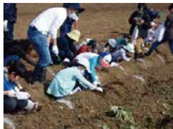
いもほりは「宝さがし」みたい!

という声が多くありましたが、青健実行委員たちも天候に恵まれた中で、久しぶりに事業を実施できたことで「安心しました」。