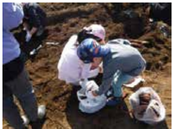
大きないもがたくさんとれました

また、昼食後は青健実行委員によるじゃんけんゲームや福引抽選会で盛り上がり、帰りのバス車中で感想を聞いたところとても好評で、また来たいと希望する声も聞かれました。