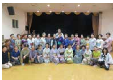
おどり練習会で特訓しました。

高島平支部には「高島平音頭」と「新河岸音頭」があり、こちらは毎年、9月8号(令和4年5月1日)で観明寺の寛文元年の庚申塔を紹介したが、同時期に建立されたにもかかわらず正面中央の陽刻の作風が異なるのは、様々な場所から移り住み六十一年間にわたって商売をしてきた彼らが、商人としての心意気を表したからである。