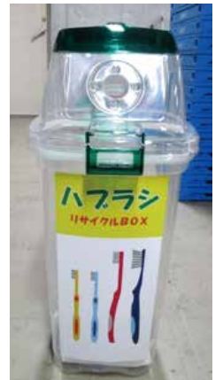
ハブラシ回収ボックス

区内の児童館及び図書館などの公共施設、並びに 商店街の店舗に設置しています。 ※詳細は区ホームページをご覧ください。