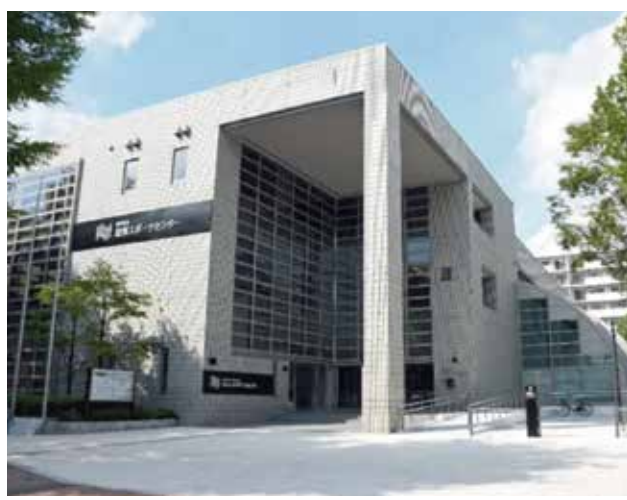
加賀スポーツセンター外観

町連新年懇談会は中止 例年1月に開催されていた町会連合会新年懇談会は、多数の参加者での飲食を伴うことから、2年連続の中止となった。