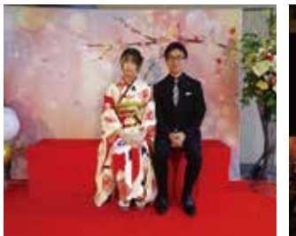
フォトスポット&新成人代表

人の日のつどいが、1月10日、成増アクトホールで行われた。時おり日差しが注ぐ空の下、会場入口では、新成人が検温や消毒を済ませ仲間同士で着席。騒がしかった客席も、緩帳が上がると同様に静寂に包まれた。式典は、支部長挨拶の後、大型スクリーンでの区長ビデオメッセージが流された。