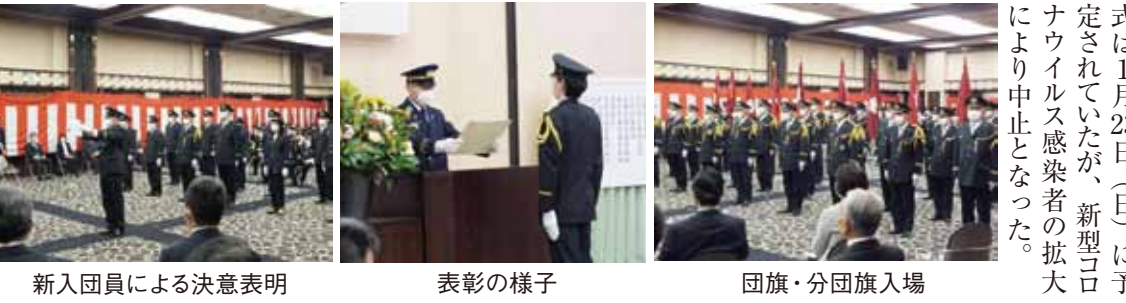
新入団員による決意表明 表彰の様子 団旗・分団旗入場

式典は、昨年の活動が特に優秀と認められた分団・団員、永年にわたって活動されている団員及び退団された団員並びにそのご家族に対して、消防総監表彰・板橋区長表彰・志村消防署長表彰・志村消防団長表彰など各種表彰・感謝状の授与が行われた。さらに、新入団員15名の紹介とその代表による決意表明が行われた。式典は肅々と進められ、最後に志村消防団長による謝辞で終了した。なお、板橋消防団始