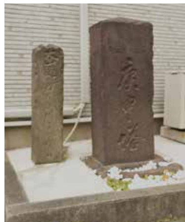
(左)大山道道標 (右)庚申塔

われ、江戸を始めとして関東各地に「富士講」が組織化され、吉田口や大宮口、須走口など各登山口を本拠として御師に導かれて盛んに登拝が行われたのである。 この道は、前野村や中台村を通って川越街道の下練馬宿(練馬区北町)にまで続いている。下練馬宿で「ふじ大山道」に入ると、先に進むと田無(西東京市)を経て甲州街道と交差する。富士山へはここから甲州街道を旅して大月を経由して吉田に入り、大山へはそのま