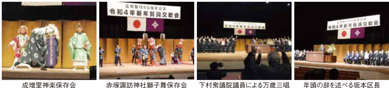
成増里神楽保存会 赤塚諏訪神社獅子舞保存会 下村衆議院議員による万歳三唱 年頭の辞を述べる坂本区長

やさいい「区政」を信条に「東京で一番住みたくなるまち」を実現するたため、より一層の理解と支援・協力を呼び掛けた。 引き続き、坂本あずまお区議会議長の挨拶、下村博文衆議院議員の挨拶と発声による万歳三唱が行われた。 その後、舞台では赤塚諏訪神社獅子舞保存会、成増里神楽保存会による演舞が披露され、12時過ぎに閉会した。