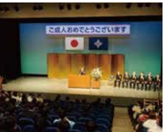
式典で祝辞を述べる牧支部長

昨年は中止となった成人の日のごい(及び同社が働きかけてくださった複数の塗料メーカーさんや副資材メーカーさん)の全面的なご協力のお陰で実現したものです。