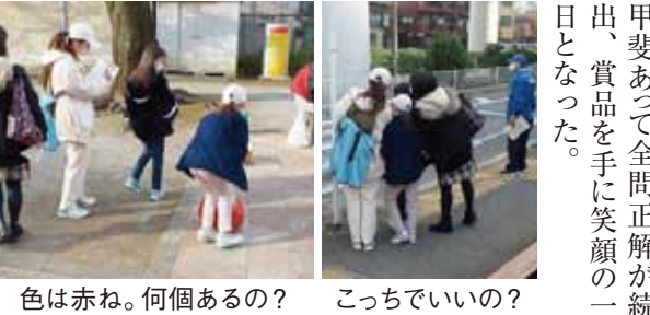
色は赤ね。何個あるの? こっちでいいの?