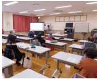
スマホ教室の様子

ウィズコロナの今、様々な情報収集や人と人との繋がりに対して、スマートフォンは欠かせないアイテムです。富士見地区では1月26日(水)と2月28日(月)の午前と午後の計4回、地域のデジタルトランスフォーメーション推進を目的とした「富士見スマホ教室」を開催しました。 地域でスマートフォンをお持ちでない方、持っているけれど操作に自信の無い方を対象に、電源の入れ方や文字の入力方法などの基礎的な操作方法から、官公庁のホームページより災害時の情報収集や防災アプリのダウンロードなどを通じて活用方法などを学びました。