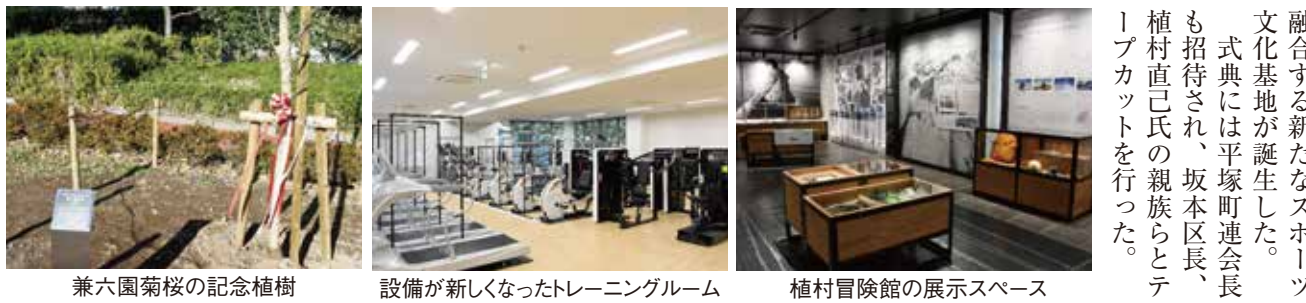
兼六園菊桜の記念植樹 設備が新しくなったトレーニングルーム 植村冒険館の展示スペース