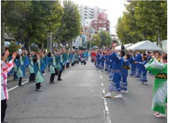
約400人の区民おどり

令和4年度「二十歳のつどい」は、各支部、青健各地区委員会との共催で、今年度も新型コロナウイルス感染症予防対策を講じた上で支部毎に実施する予定である。