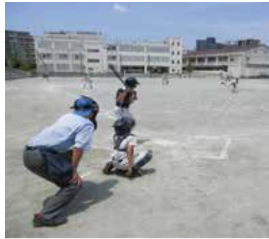
晴天のなか白熱した試合

青健仲町地区委員会では、6月19日(日)に板橋第二中学校で、6月25日(土)に小豆沢野球場で2日間に行われ、少年野球仲町地区大会を開催しました。 今年の野球大会は、コロナ禍と猛暑の2日間ではありましたが、ひとたび試合が始まると子ども