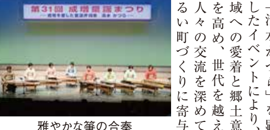
雅やかな箏の合奏

成増童謡まつり 4年ぶりの有観客開催 成増支部の秋の代表行事である成増童謡まつりが10月8日、成増アクトホールで行われた。4年ぶりに観客を入れ、通常に近い規模で開かれた今回は、主催者・区長挨拶、来賓紹介後の箏の演奏に始まり、小中学校の児童・生徒や一般コーラス団体の合唱など計9団体が出演、発表の度に会場内は多くの拍手に包まれた。 感染対策として、出場団体はマスク姿の合唱とし、観客と舞台一体