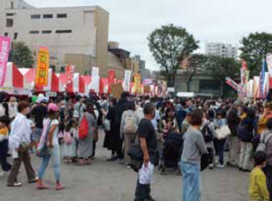
賑わう楽市楽座ひろば（板一中）