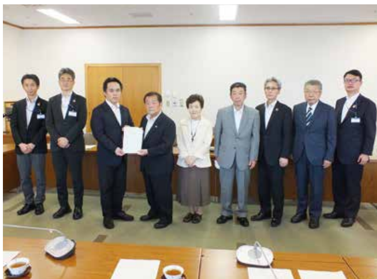
議長に要望書提出