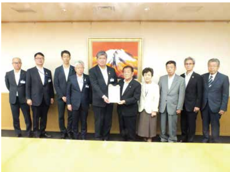
区長に要望書提出

ます。その際の避難所の開設については、区でも検討していただいているが、高層住宅などの在宅避難者に対する左記支援策の検討について要望いたします。