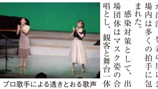
プロ歌手による透きとおる歌声

の把握 会場内…3密にならないよう配置、大声での会話を控える 運営…会場の規模により二部制で実施、飲食を伴う懇親会は中止 ○案内状の発送 12月上旬予定 ○対象者 平成14年4月2日生～平成15年4月1日生 ※ 新型コロナウイルスの感染状況によっては中止または変更になる場合があります。