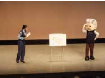
ユーモアを交えた交通安全教室

交通安全区民大会開催 9月12日（月）午後2時から成増アクトホールで「板橋区交通安全区民大会」が開催された。この大会は、秋の全国交通安全運動の実施に先立ち、地域における交通安全意識の高揚を図るとともに、交通安全運動の重点等の周知と交通事故防止を図ることを目的に開催された。