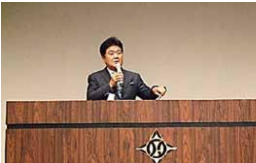
堀尾氏による講演の様子