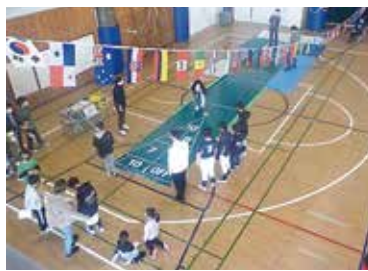
シャフルボードを楽しむ子どもたち