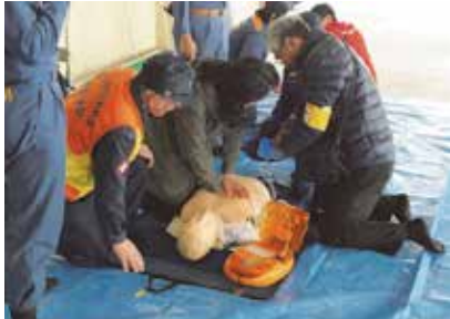
心臓マッサージとAEDを使った訓練