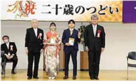
仲宿地区(グリーンホール)