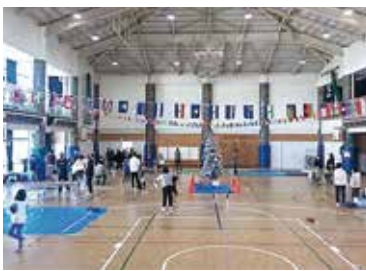
会場中央にクリスマスツリー

事業実施中の体育館には子どもたちの元気な声があふれていました。また結果発表では、各学年1位の児童に記念品が贈られ会場内は大いに盛り上がりました。実施後のアンケートでも「楽しかった」「また参加したい」などの意見が多く寄せられ、地区内に