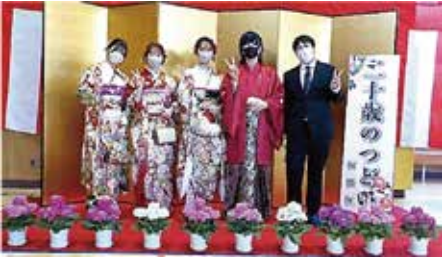
清水地区(志村第三小学校)