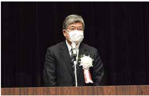
挨拶する坂本区長

12月23日(金)午後1時30分から区立文化会館大ホールにおいて、町の功労者等への感謝状贈呈式(板橋区主催)が行われ、終了後引き続き同会場で第37回地域振興研修会(共催:板橋区町会連合会・社会福祉法人 板橋区社会福祉協議会、後援:板橋区)が開催された。 感謝状贈呈式では、永年にわたり住みよい町づくりや防災事業などに貢献されている町の功労者239名と防災功労者34名、集団回収登録団体14団体が対象となり、坂本健区長から分野別地域別代表者に感謝状が手渡された。そ