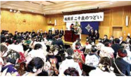
成増地区(成増アクトホール)