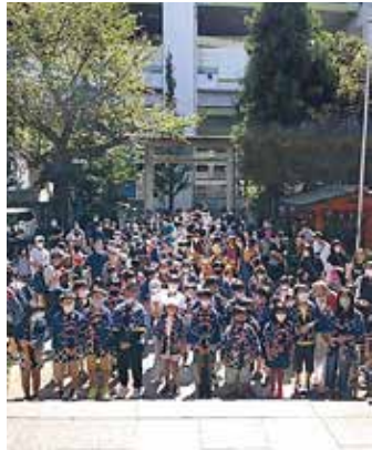
参加者で大賑わいの熊野神社

子どもたちには、お楽しみのお菓子が配られました。親子500人以上が集まりましたので、用意した260個はすべてなくなっていました。大人神輿はできませんでしたが、町会内に響き渡る子どもたちの元気な声を聴くことができてよかった、と携わった町会役員全員が感じる一日となりました。