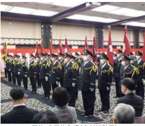
団旗・分団旗入場(志村消防団)

び退団された団員並びにそのご家族に対して、消防総監表彰・板橋区長表彰・消防署長表彰・消防団長表彰など各種表彰・感謝状の授与が行われた。 さらに、新入団員の紹介とその代表による決意表明が行われた。 式典は肅々と進められ、最後に消防団長による謝辞で終了した。