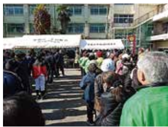
防災訓練参集風景

町会活動の中心となっている場所は水久保公園と公園内にある集会所です。町会で開催される行事の活動拠点です。「役員会」「町会祭典」「こども祭り」「ラジオ体操」「大災害時避難誘導・避難所開設訓練」等々の活動がここで行われています。公園は、子供から高齢者までの憩いの場として多くの出来場としてなっています。また、平和公園には令和3年3月に中央図書館が建設され、町の環境も少しずつ整備されてきています。