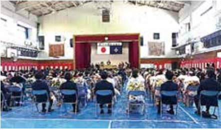
舟渡地区(舟渡ホール)