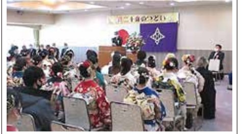
仲町地区(仲町地域センター)