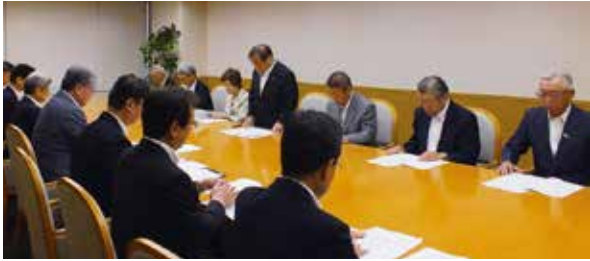
平塚会長から要望の概要説明

成金は、減額や削減しないようお願いいたします。 (2) SNSの活用については、活動の周知や情報共有等に有効であり、携帯電話やスマートフォンを用いやすいと聞いていますが、具体的な活用をすすめるにあたって、操作方法等の技術的支援策の教示をお願いいたします。 2 自転車及び電動キックボードの安全利用について【継続(見直し・追加)】 平成27年6月1日から道路交通法が改正され、自転車走行の規制が強化されました。 車両としての自転車の安全な利用を認識してもらうとともに、利用マナーの向上をめざした啓発活動を警察署と連携し、積極的に実施していただくことを要望いたしましたところ、警察官による取り締まりの強化を所管警察署に要望していただき、ありがとうございます。 しかしながら、現在もマナーの悪い利用者が散見されます。さらには、電動キックボードに対する規制緩和が実施されましたことを受け、次の事項について要望いたします。 (1) 自転車のマナーの啓発については、ロードバ