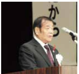
平塚町連会長の挨拶

その後、来賓・登壇者の紹介があり、漫才コンビ「U字工事」への一日警察署長の委嘱があった。