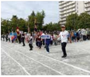
入場行進でグラウンドに集合!