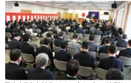
区政功労者表彰式にあたり、多くの方が参列された