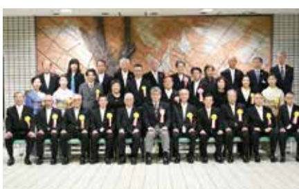
受賞者及びご親族と区長ほか関係者一同