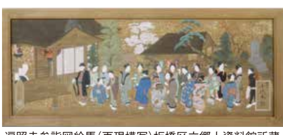
遍照寺参詣図絵馬(再現模写)板橋区立郷土資料館所蔵

一般的に寺社へ奉納された絵馬は、願いを託した人々の思いを今日に伝える役割を果たしているが、遍照寺所蔵の絵馬は