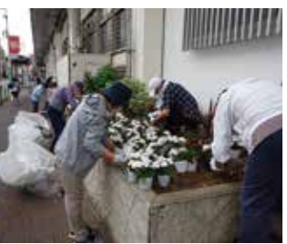
蓮根駅前花壇の植替え作業

蓮根駅前の花壇は、5月と11月の2回、蓮根地区の緑化推進委員が夏と冬の草花に植え替えを実施しています。また夏に