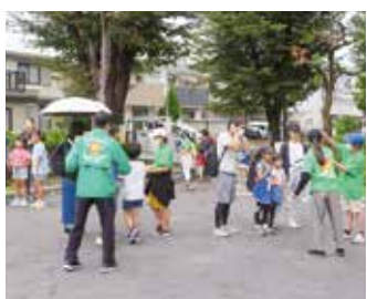
ウォークラリーのゲームポイント（成増）