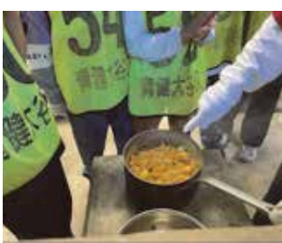
美味しく作れました!

初日は火起こし体験と野外炊飯です。野外炊飯ではカレーライスを作り、見事完成しました。2日目は川遊びとキャンプファイヤーです。キャンプファイヤーでは都会で学ぶ機会の少ない火の神秘さを知り、練習してきたダンスを笑顔いっぱい披露してもらいました。