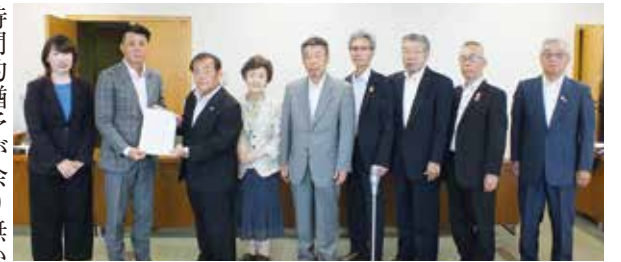
議長に要望書を提出

三鷹市の事例を参考に、板橋区でも同様の取り組みが可能かどうか研究を進めていただき、事業化の可否について教示していただくよう要望いたします。 4 都立城北中央公園の再整備について【新規】 都立城北中央公園は区の中央部に位置し、長年にわたり区民の憩いの場として利用されており、上板橋駅南口駅前再開発事業が完成の暁には、駅から一直線に通じるルートが確保され、駅を介し一層多くの区民の利用が見込まれます。 現在、都市計画に基づき用地買収や大雨に対応する調節池の工事が進められるなど、公園の拡張・再整備が進捗しており、区としても調節池の上部利用について、都の担当者や情報共有を図っていること聞いております。 一方、7月には地元町会等に対し、調節池工事に関する現場見学会が実施され、調節池の上部利用策の確定については、