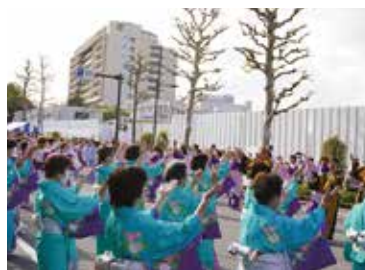
区民おどりに大勢参加