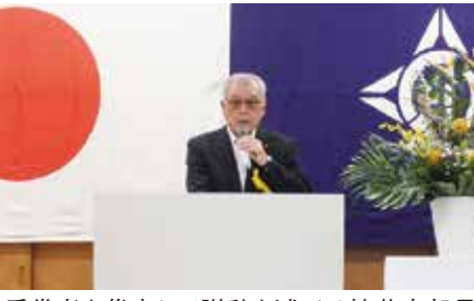
受賞者を代表して謝辞を述べる植草支部長