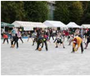
ボール送り競争スタート

最終種目の「町会対抗ボール送り競争」は、町会長を先頭に、各町会15名の選手が、体を前に向けたまま、足の間から後ろに向けてボールを転がして送る競技です。一番後ろの選手が受け取ったボールを、走って先