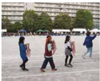
今年、優勝カップを手にするのは？（板橋）