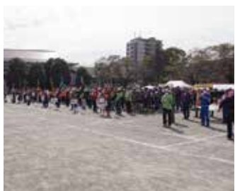
競技前、気合十分の整列（仲宿）