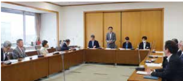
議長から要望書受領の挨拶

安全な利用を認識してもらうとともに、利用マナーの向上をめざした啓発活動を警察署と連携し、積極的に実施していただくことを要望いたしましたところ、警察官による取り締まりの強化を所管警察署に要望していただき、ありがとうございます。 しかしながら、現在もマナーの悪い利用者が散見されます。さらには、電動キックボードに対する規制緩和が実施されましたことを受け、次の事項について要望いたします。 (1) 自転車のマナーの啓発については、ロードバ