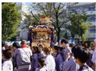
活気あふれるおみこし

るオープニングパレード、幼稚園児や小学生による音楽パレード、いたばし戦国絵巻武者行列、高島秋帆鉄砲隊などの演目が続いた後、町会連合会から4年ぶりとなるおみこし・子どもみこし・木