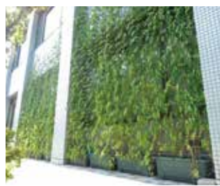
蓮根地域センターの緑のカーテン

しかし、今夏の記録的な猛暑により蓮根駅前の花壇の草花が一時枯れてしまい、新たに植え替えたり、対策として水やりを多く実施することになりました。暑い中での水やりは、朝夕夕方といえども大変ではありませんが、蓮根駅を利用される方から感謝の言葉をいただきました。