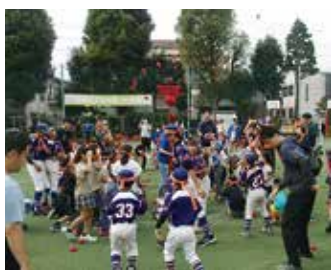
みんなで玉入れ（清水）