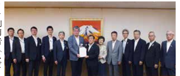
区長に要望書を提出

安全な利用を認識してもらうとともに、利用マナーの向上をめざした啓発活動を警察署と連携し、積極的に実施していただくことを要望いたしましたところ、警察官による取り締まりの強化を所管警察署に要望していただき、ありがとうございます。 しかしながら、現在もマナーの悪い利用者が散見されます。さらには、電動キックボードに対する規制緩和が実施されましたことを受け、次の事項について要望いたします。 (1) 自転車のマナーの啓発については、ロードバ