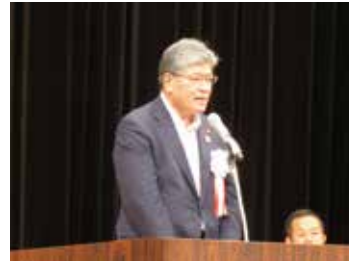
坂本区長による主催者挨拶

次に、交通安全都市宣言が朗唱され、最後に特別ゲストの演歌歌手、香西かおりさんが一日警察