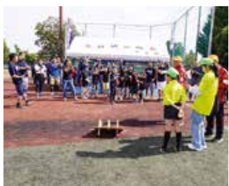
輪投げの一投に大声援（志村坂上）